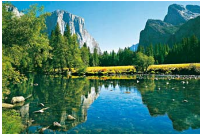
▲ Yosemite Nationalpark

Ein Tag voller Kontraste erwartet uns. Ein Höhepunkt ist der Zion NP, dessen einzigartige Landschaft von Wind, Zeit und der Kraft des Virgin River geschaffen wurde. Am Abend erreichen wir Las Vegas. Eine Lichterfahrt über den legendären Strip wird fakultativ angeboten. ca. 395 km