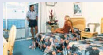
▲ Wohnbsp. Standard: Castle Ocean Resort Waikiki **

Bitte beachten Sie die gesonderten Gepäckbestimmungen auf den Flügen von San Francisco nach Hawaii und zurück. Es können vor Ort noch Kosten für die Gepäckbeförderung anfallen.