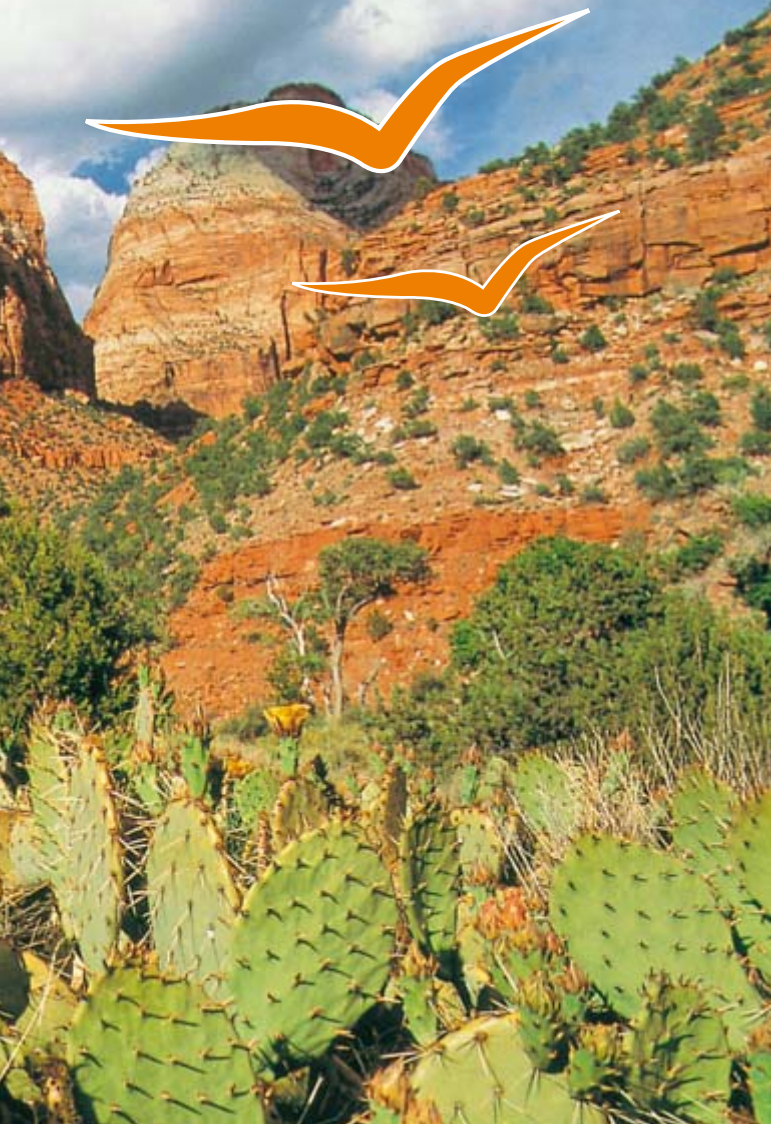
▲ The Three Patriarchs, Zion Nationalpark

Es gelten die allgemeinen Leistungsbeschreibungen auf S. 280.