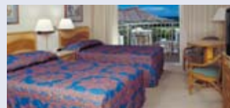
▲ Wohnbeispiel Standard Plus: Pacific Beach ****

Detaillierte Hotelbeschreibungen finden Sie im FTI Hawaii-Katalog auf S. 33 + 38