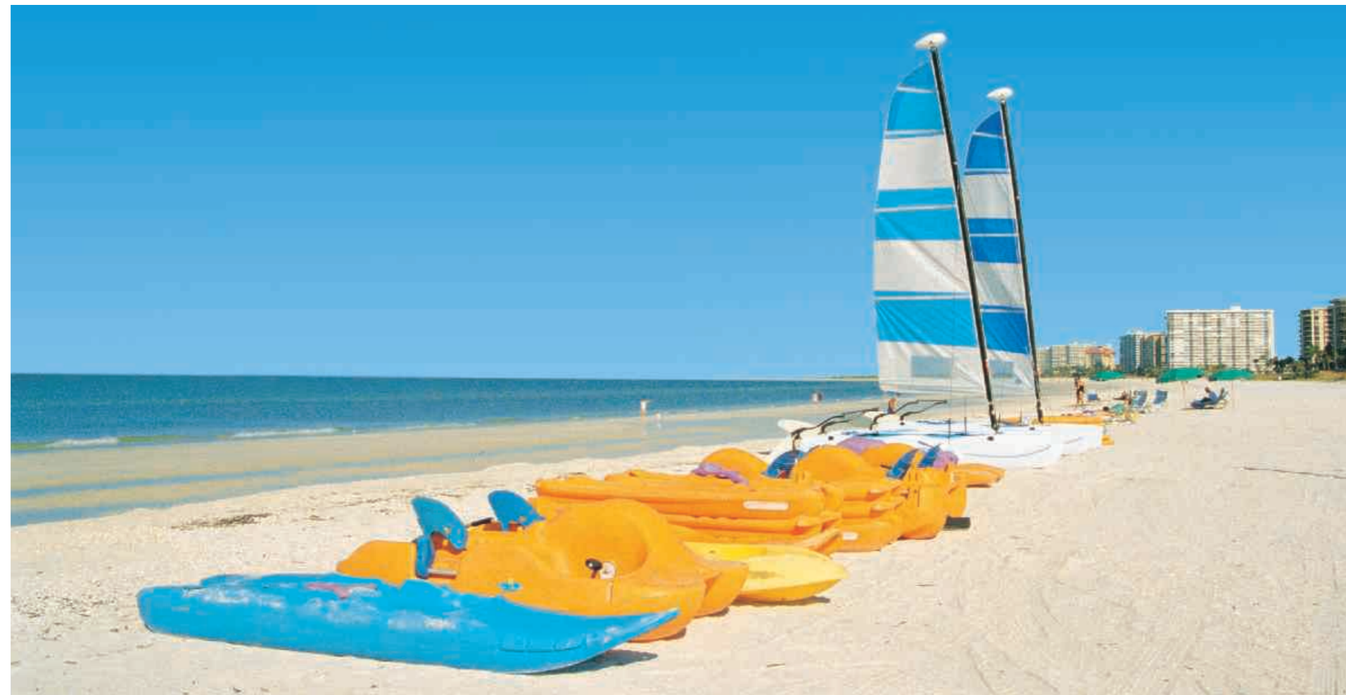
▲ Strand nahe Naples

1. Tag: Willkommen in Florida Bei Buchung des Rundreisepakets inklusive Flug (mit Lufthansa) erfolgt der unbegleitete Shuttletransfer zum Hotel. Dort werden Sie von Ihrer Reiseleitung in Empfang genommen. Hotel: Hyatt Place Miami Airport ****